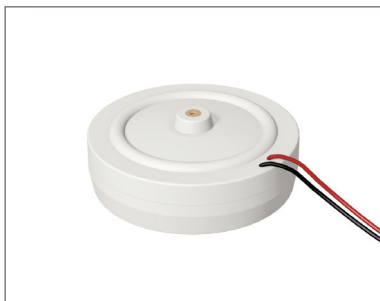
Körperschallwandler ADD-/CAB-SO KSW

LUX ELEMENTS®-ADD-SO KSW (LEADD4000) / -CAB-SO KSW (LESPA1209) – Körperschallwandler für die Mittel- und Hochtonwiedergabe auf einer schwingfähigen Fläche wie Hartschaum, Kabellänge 3 m, IP 68, inkl. einer Stockschraube und einer in Hartschaum eingelassenen Hartkunststoffplatte zur Befestigung.