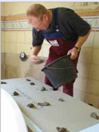
■ Dort, wo sich die Bohrlöcher befinden, wird auf der Rückseite der Wannerverkleidungen jeweils ein Batzen Ansetzkleber LUX ELEMENTS®-COL-AK aufgebracht.