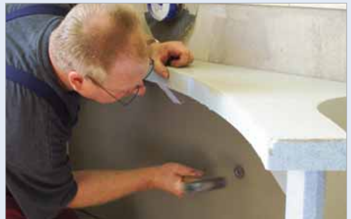
■ Anschließend wird die Verkleidung mit der Rückseite zur Wand angeklebt und mit Schlagdübeln LUX ELEMENTS®-FIX-FID 130 an der Wand verankert.