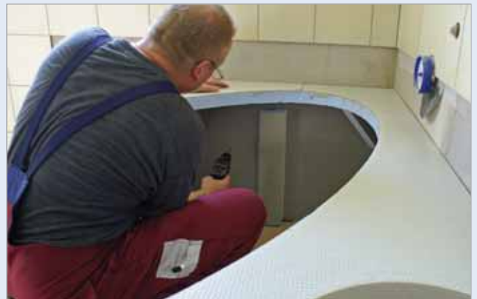
■ Zunächst werden die Bohrlöcher durch die Verkleidung vorgebohrt, bevor die Verkleidung entfernt und die Bohrlöcher auf Tiefe gebohrt werden.