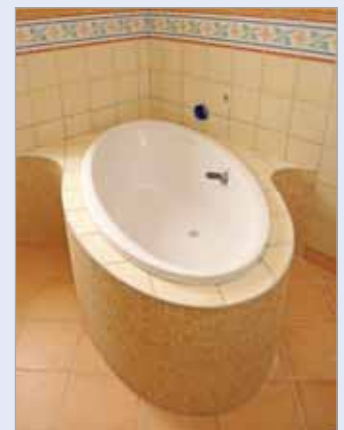
■ Die fertig montierte Wannerverkleidung nach der Verfliesung.