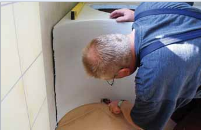
■ Die Höheneinstellung der Verkleidungselemente erfolgt mit Hilfe der eingebauten Stellfüße.