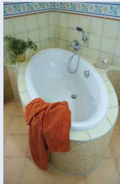
■ Das gerundete Ansatzstück der Ablage ist eine Sonderanfertigung aus der Produktgruppe LUX ELEMENTS®-CONCEPT – individuelle Konzepte und Bauteile.

LUX ELEMENTS GmbH & Co. KG An der Schusterinsel 7 • D - 51379 Leverkusen Tel.: +49 (0) 21 71/72 12-0 Fax: +49 (0) 21 71/72 12-40 info@luxelements.de • www.luxelements.com